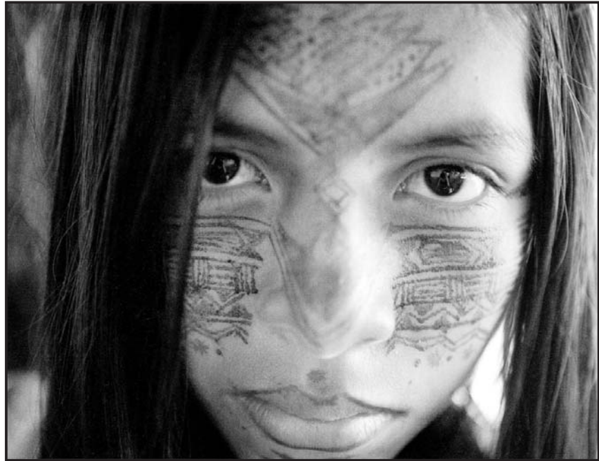
Muchacha kichwa en Sarayaku, Ecuador.