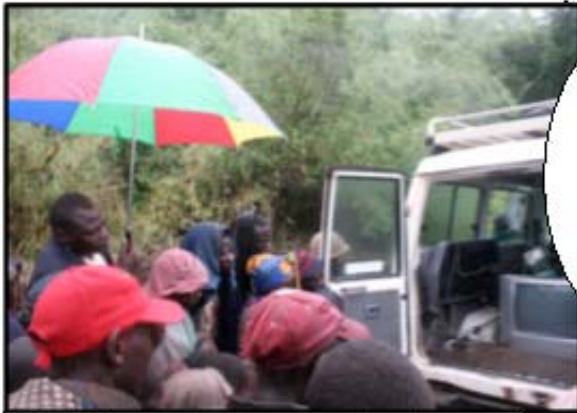
Y el video está creando olas

No pensé que me dejarían tocar una cámara, pero ahora estoy feliz de poder decir que he aprendido como hacer un video