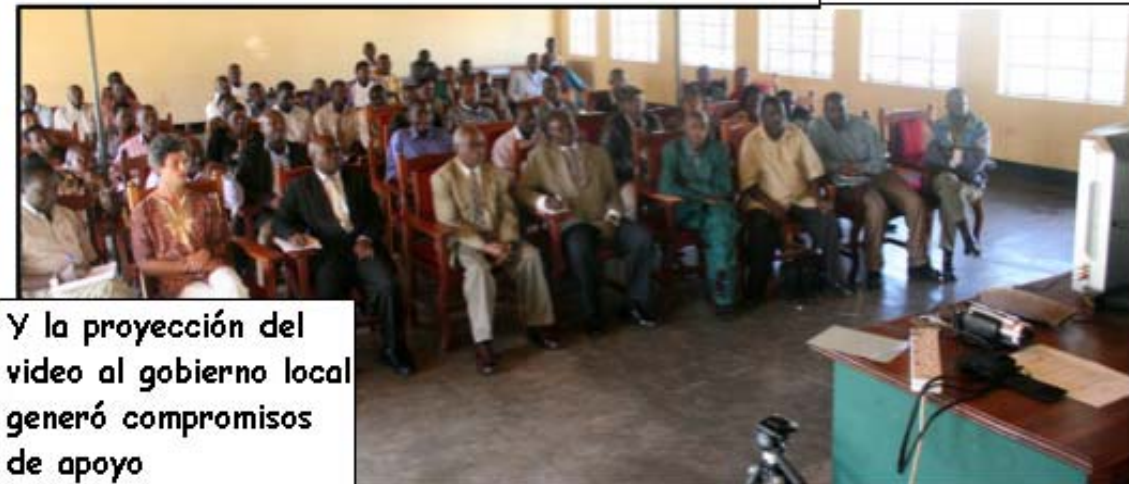
Y la proyección del video al gobierno local generó compromisos de apoyo

Los pocos Batwa que son dueños de tierras serán asistidos en adquirir sus títulos.