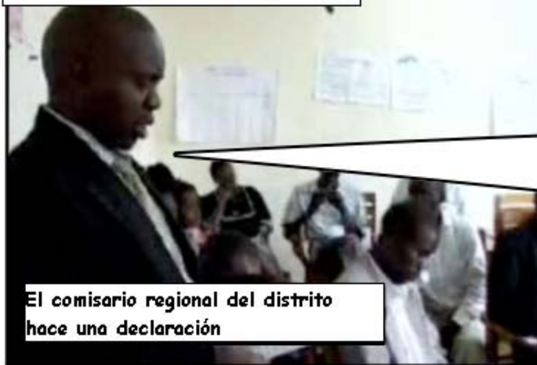
El comisario regional del distrito hace una declaración

El gobierno tomará seriamente el reasentamiento de los Batwa. No será algo a resolver solamente para las organizaciones de la sociedad civil.